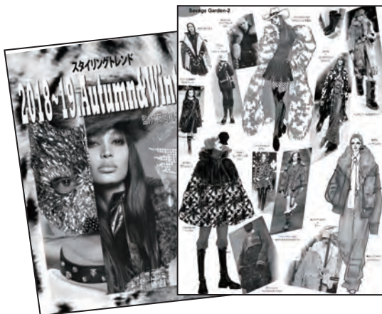
イラスト付きマップ B4カラー / 20ページ